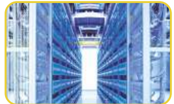
Data Sistem Odaları