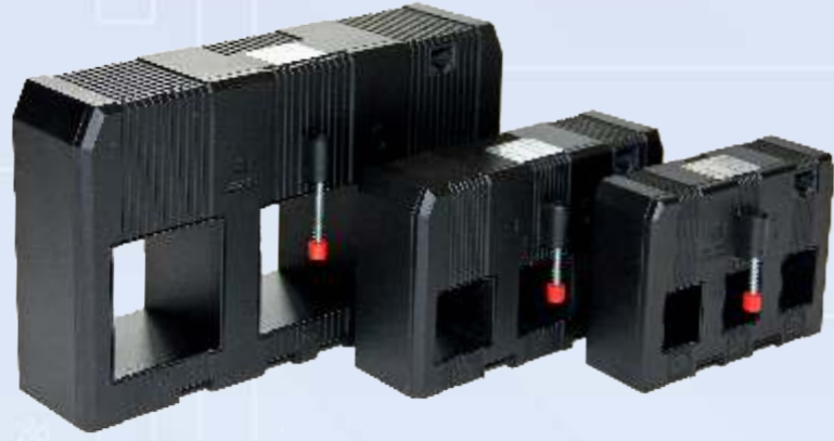
3 fazlı plug&meter akım trafosu