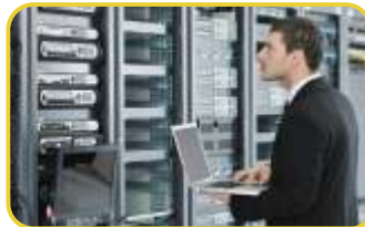
Güvenlik Kontrol Sistemleri