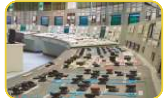
Data Sistem Odaları